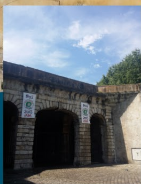
Entrée des casemates de la Porte d'Espagne