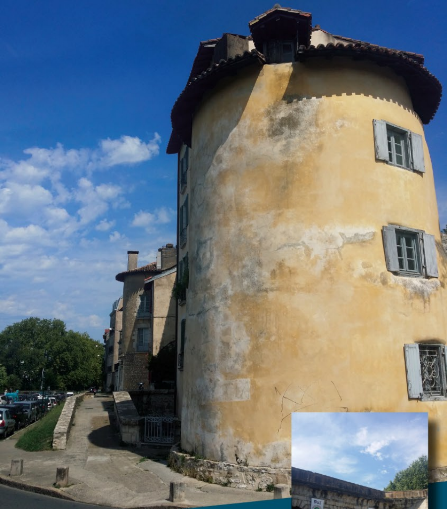
Tour Vieille-Boucherie