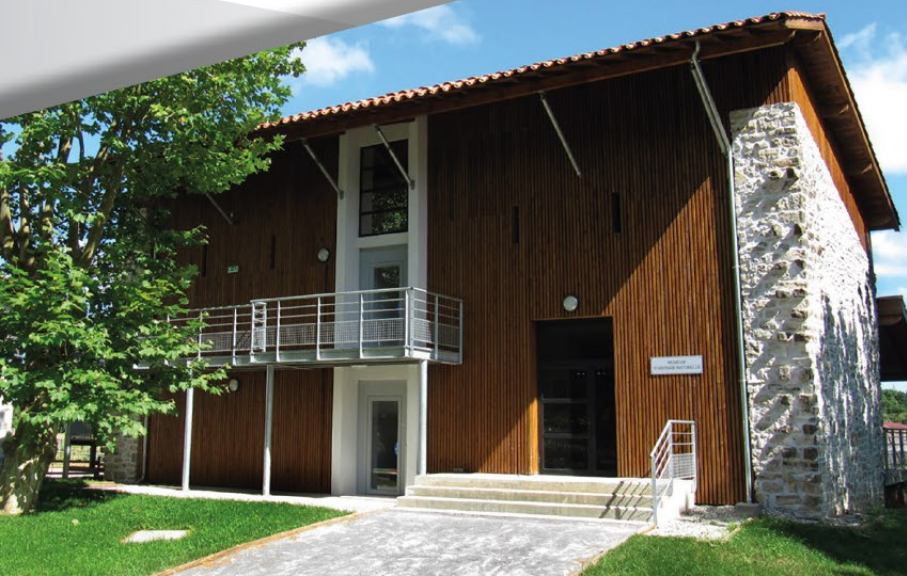
Plaine d'Ansot, muséum.

Dimanche : de 10h à 12h et de 14 h 30 à 18h