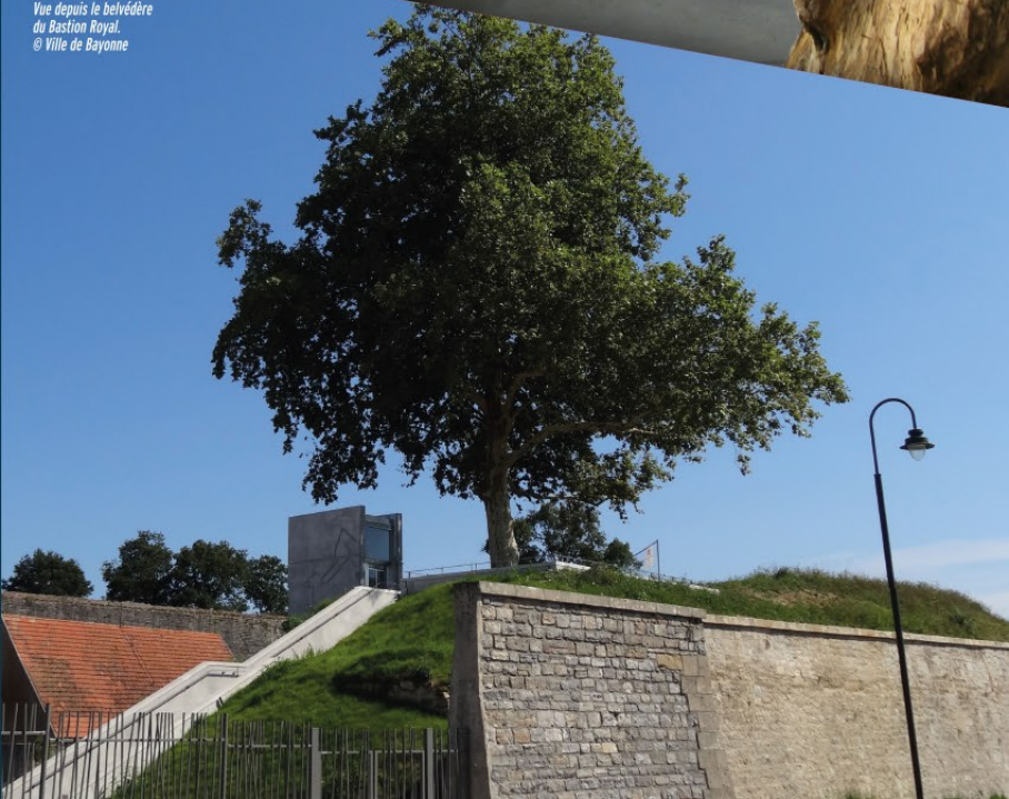
Vue depuis le belvédère du Bastion Royal.