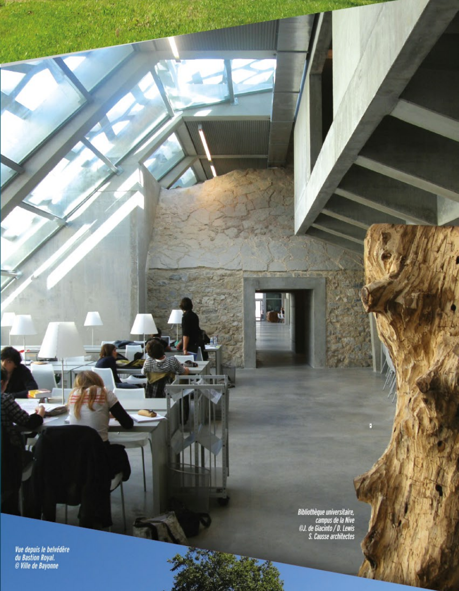
Bibliothèque universitaire, campus de la Nive © J. de Giacinto / D. Lewis S. Causse architectes