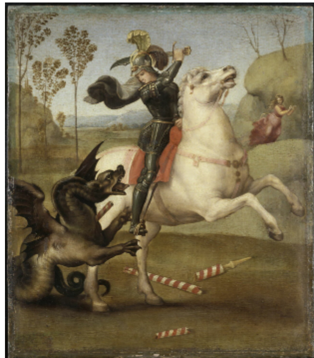
1. Saint Georges luttant avec le dragon, 1503 / 1505 Raphaël, Raffaello Santi, dit Musée du Louvre, département des Peintures