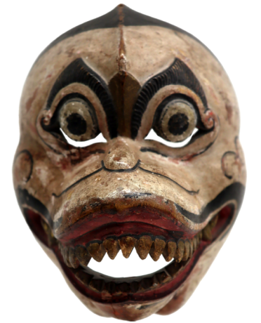
4. Masque de renard Haxeria, Owantshoozi, 2026 © Owantshoozi