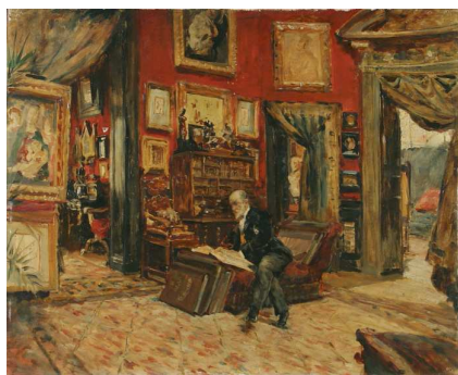
Léon Bonnat dans son hôtel particulier vers 1896

Léon Bonnat était un exceptionnel collectionneur d'œuvres d'art. Grâce aux revenus que lui procure la vente de ses tableaux, il réunit une très importante collection comportant des dessins (Michel-Ange, Raphaël, Rembrandt, Ingres...), des peintures, des sculptures, notamment des bronzes de Barye... dont il fait don, pour partie en 1901, pour l'essentiel après son décès (legs en 1922) à la ville de Bayonne, qui édifie, pour la présenter, le musée qui porte son nom et dont les portes ouvrent au public en 1901. Certaines pièces seront également données, de son vivant ou à sa mort, au musée du Louvre et à l'École des Beaux-Arts à Paris.