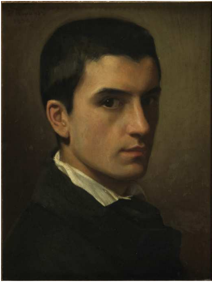
Léon Bonnat Autoportrait à 17 ans, 1850