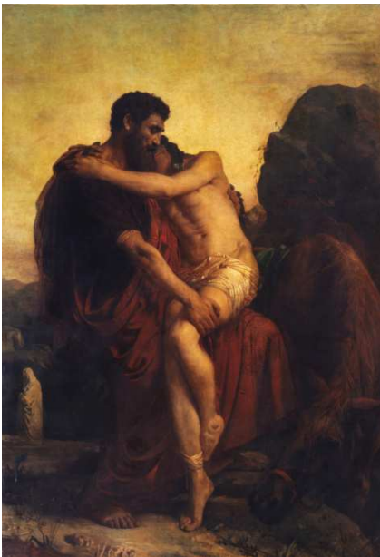
Léon Bonnat Le Bon Samaritain, 1859